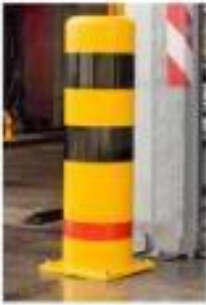
02 POSTES DE SEGURIDAD (OPCIONAL)